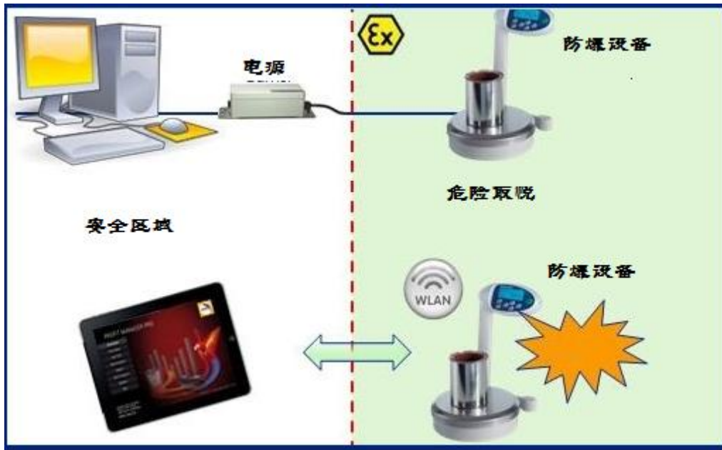
图 1 防爆无线仪表的应用示意图

在易于发生爆炸的区域搭建这样的数据测量、通信及控制系统的话，需要采用具有防爆认证的设备，包括计算机、掌上电脑、称重指示器电源，以及连接这些设备的线缆，开关等等。一般来说，防爆设备的价格较为昂贵，如果把这一整套的设备都放置在危险区域的话，那组建这套系统的花费巨大。如图 1 是较为理想的方案。把关键的称重测量设备放置在危险区域，而计算机或者掌上电脑等的外围设备可放置在安全区域。在这种应用方案下，采用无线通信技术，则是非常便捷，快速，低成本的设计。