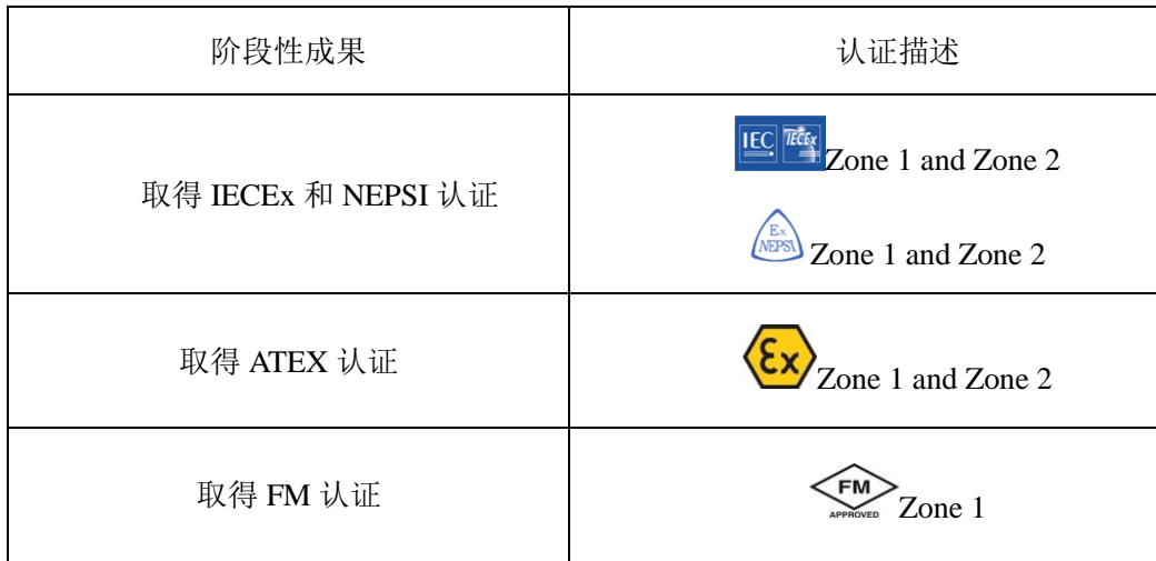
表 1 已获取防爆认证

在易于发生爆炸的区域搭建这样的数据测量、通信及控制系统的话，需要采用具有防爆认证的设备，包括计算机、掌上电脑、称重指示器电源，以及连接这些设备的线缆，开关等等。一般来说，防爆设备的价格较为昂贵，如果把这一整套的设备都放置在危险区域的话，那组建这套系统的花费巨大。如图 1 是较为理想的方案。把关键的称重测量设备放置在危险区域，而计算机或者掌上电脑等的外围设备可放置在安全区域。在这种应用方案下，采用无线通信技术，则是非常便捷，快速，低成本的设计。