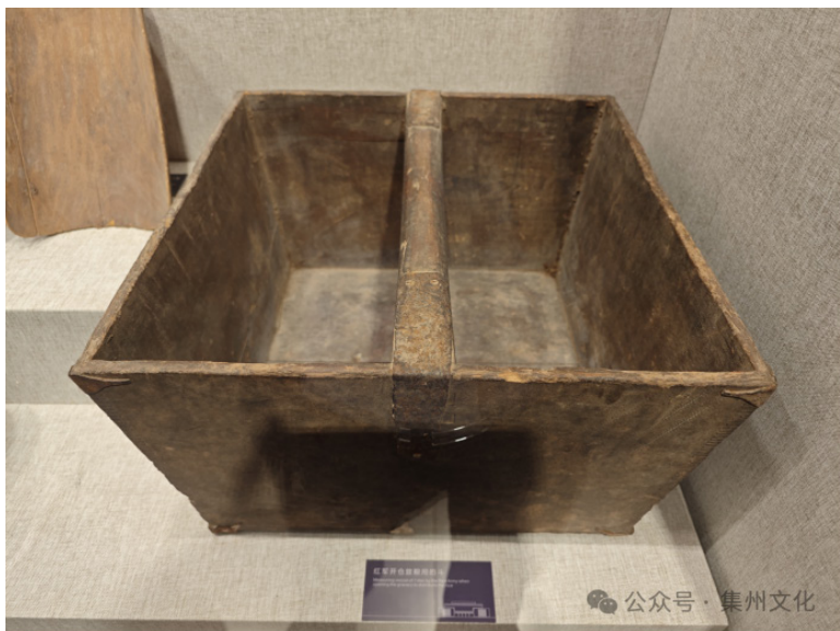
图3 现存于川陕革命根据地烈士陵园博物馆红军开仓分粮用的斗