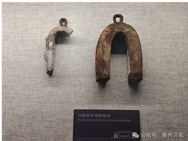
图5 现存于川陕革命根据地烈士陵园博物馆红军开仓分粮用的砵锤

1933年9月2日发布《川陕省苏维埃政府关于土地、粮食、肃反问题》的布告，要求征收公粮每个成年五背田起算，分两季捐纳（五背捐五升，六背捐七升五，八背一斗二升五，九背一斗五，十背二斗。老年、小孩按四背起，富农按三背起，照上面比例推算）。此数以下不缴。升斗规定，五斤一升，十升一斗，两斗一背。应纳公粮自动送交区苏公粮仓妥存。