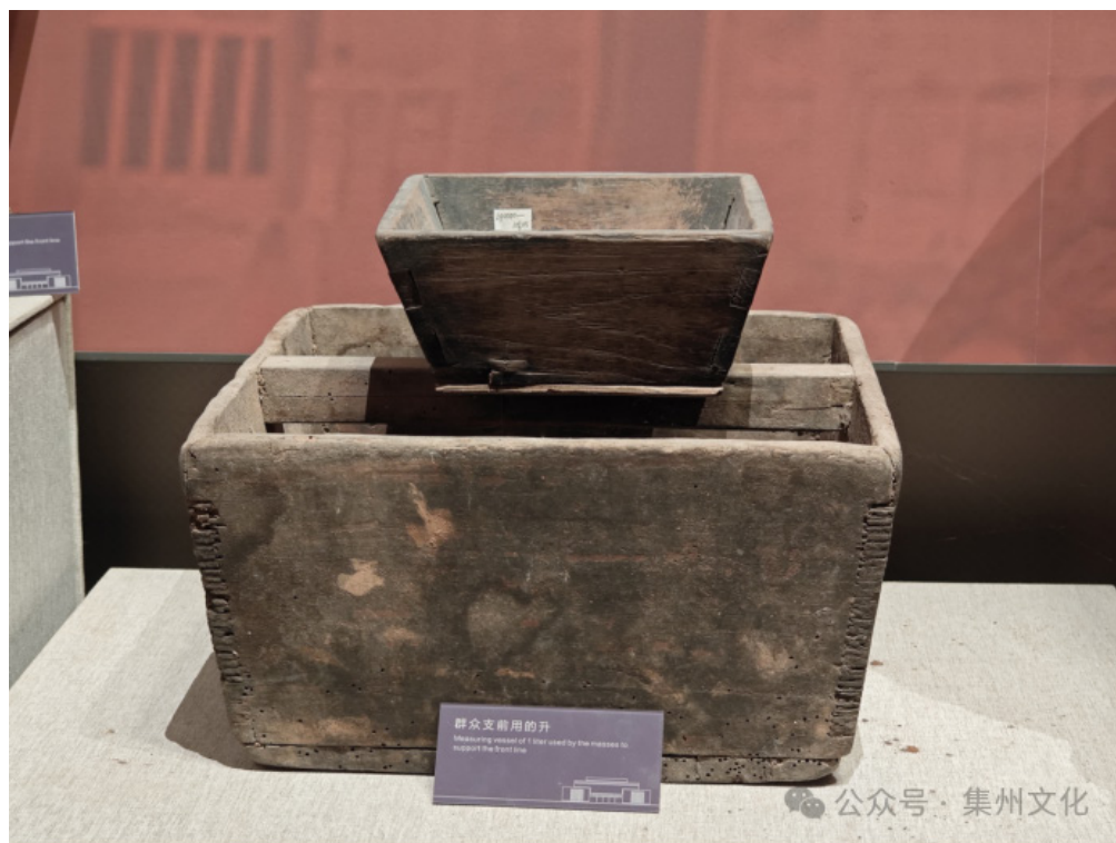
图2 现存于川陕革命根据地烈士陵园博物馆内的升、斗

1933年2月，川陕省第一次工农兵代表大会通过《川陕省苏维埃组织法》“（二）苏维埃组织系统及其工作。县苏维埃：3. 县经济委员会：……消灭大斗小秤，统一全县度量衡……川陕省苏维埃：甲、关于中央集权的：……3. 经济委员会：……（2）……统一苏区度量衡”。《财政经济问题决议草案》中规定，“苏区经济要厉行节省，一切浪费行为应给予严重的打击……一切机关里面规定工作人员数目，反对徇私舞弊，浪费公物，对粮食盐巴燃料等严格按人计算厉行节省……各级苏维埃的开支，按期清算，厉行统一经济，工作人员一律发给工资……苏区内的秤、尺、升、斗，应实行政府专卖，统一度量衡，严禁大斗小秤，一切舞弊情形”。