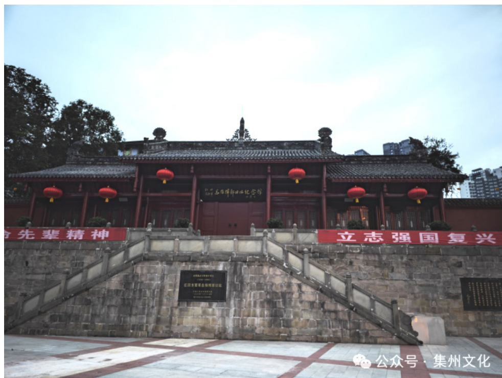
图1 位于通江县城的红四方面军总指挥部旧址

当地革命武装汇合，攻下通江、南江、巴中等县，开辟了川陕革命根据地。根据地范围为23个县，约600万人口。