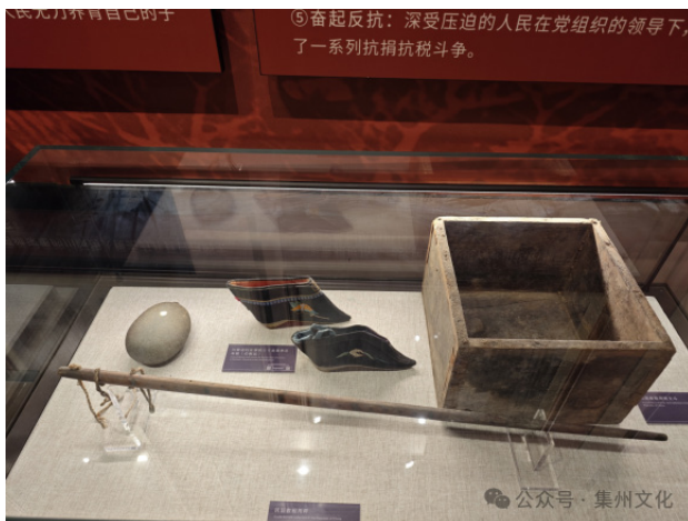
图6 现存于川陕革命根据地烈士陵园博物馆川陕苏区用的杆秤

（4）《条例》明确了公粮的分配，“以十分之四作苏维埃公务人员及来往运输队吃，以十分之四作红军吃，以十分之二作社会保险”。公粮的集中，“以区为单位，每区设置仓库保存”。这都和度量衡器具的使用有关。