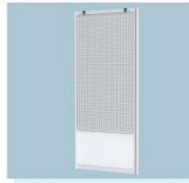
网片 A17 Peg Board 1800L X 900W