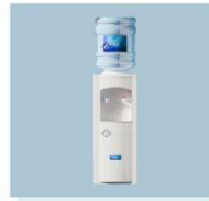
立式饮水机 B04 Water Dispenser 300L X 300W X 960H