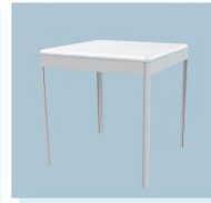
方桌 A05 Square Table 730W X 730W X 750H