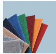
地毯 B05 Carpets