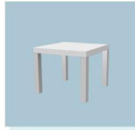
咖啡桌 A07 Coffee Table 550L X 550W X 450H