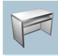
咨询台 A04 Information Desk 1000L X 500W X 750H