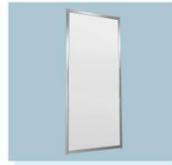
展板/围板 A19 Display Panel 1000W X 2440H