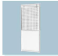
洞洞板 A18 Mesh Board 1200L X 900W