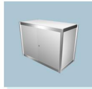
锁柜 A13 Locker 1000L X 500W X 750H