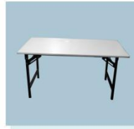
长方桌 A08 Long Table 1400L X 600W X 750H