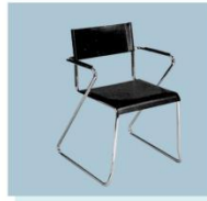
扶手椅 A02 Arm Chair 460W X 400D X 450H