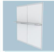
平层板 A15 Flat Plate 1000L X 300W