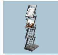
立式资料架 A20 Vertical Shelves 270L X 250D X 1200H