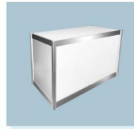
低柜 A14 Low Cabinet 1000L X 500W X 750H