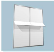
斜层板 A16 Inclined Laminate 1000L X 300W