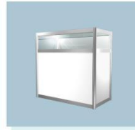
玻璃低柜 A09 Low Glass Cabinet 1000L X 500W X 1000H