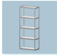
高货架 A12 High Shelf 1000L X 500W X 2500H