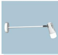
LED 长臂射灯 B01 Led Long Arm Spotlights