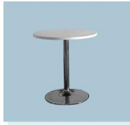
圆桌 A06 Round Table 800Φ X 800H