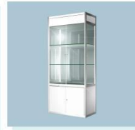
玻璃高柜 A10 High Glass Cabinet 1000L X 500W X 2000H