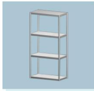
低货架 A11 Low Shelf 1000L X 500W X 2000H