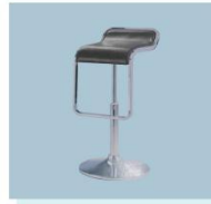
吧椅 A03 Bar Chair 320L X 750 X 850H