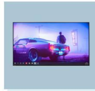
42寸液晶电视 B03 42-inch LCD TV